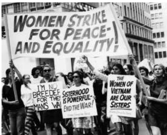
Figura 1: Mulheres protestando durante a segunda onda.

Já a denominada “segunda onda”, ilustrada na Figura 1, que ocorreu entre os anos 1960 e 1980 6 , lutou por um feminismo mais aprofundado nas questões de gênero, com uma atenção mais plural dentro do movimento, fazendo recortes de raça, classe e sexualidade. Um questionamento importante, também levantado, a princípio, nesse momento, foram as representações culturais do feminino na TV, filmes, revistas e na publicidade (REY, 2019 p. 44).