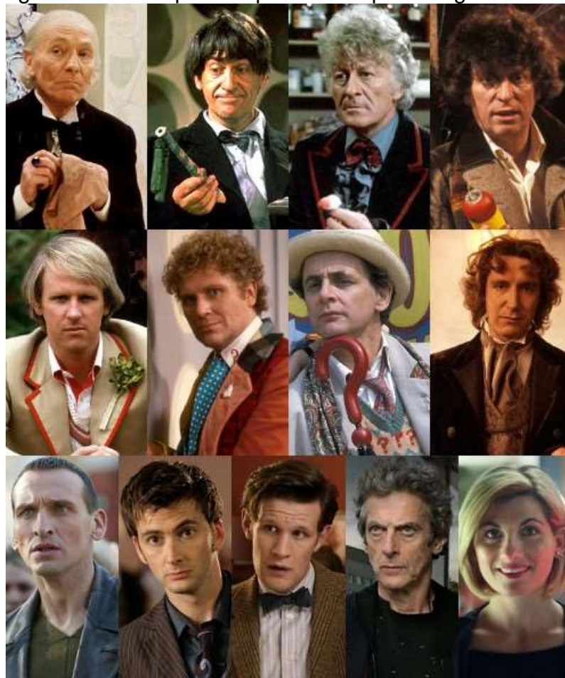
Figura 4: Atores que interpretaram o personagem Doctor.