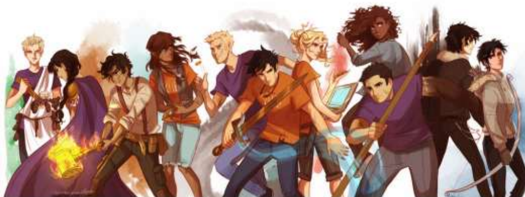
Figura 3: Fanart de Viria13.

Alguns desses produtos criados por fãs são as Fanfics e Fanarts , histórias e ilustrações, respectivamente, criadas de fãs, para fãs. Ilustradores e autores já ficaram mundialmente famosos por suas criações inspiradas em produtos midiáticos, a ilustradora Viria13 é um exemplo disso, suas fanarts, como a Figura 3, da série de livros Percy Jackson escritos pelo autor Rick Riordan ficaram tão conhecidas e admiradas que o autor decidiu contratá-la para criar as ilustrações oficiais dos personagens principais da saga 8 .