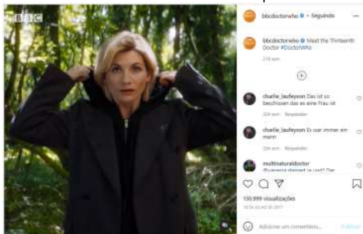
Figura 5: Vídeo de anúncio da nova Doctor postado no instagram