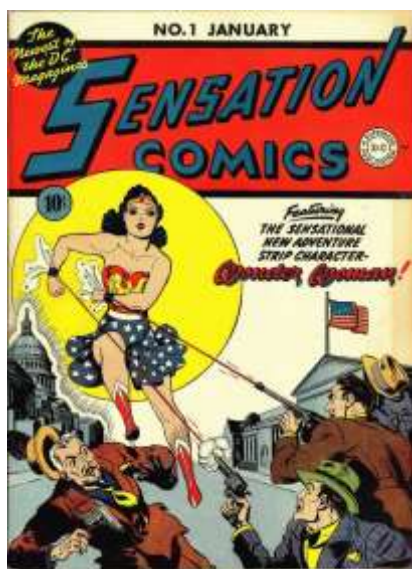
Figura 2: Primeira HQ Mulher Maravilha.

1941, ilustrada na Figura 2, que apesar de não ser a primeira HQ com uma personagem feminina como protagonista, foi a de mais sucesso em sua época. A História de Diana, nome que a Mulher Maravilha 7 recebeu ao nascer, foi muito revolucionária, mas também acabou caindo em estereótipos de gênero, sendo o principal a hipersexualização da personagem (REY, 2019).