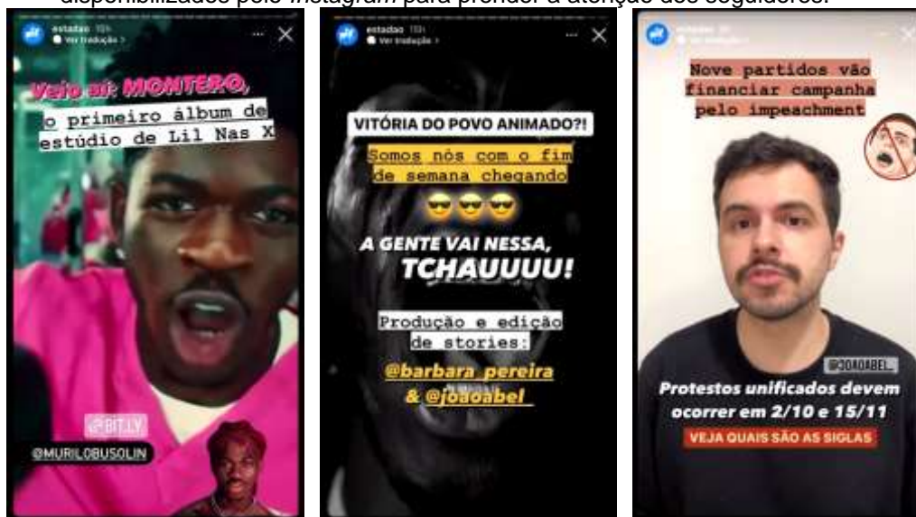
Figuras 8, 9 e 10: Stories do Estadão. Percebe-se claramente a apropriação dos recursos disponibilizados pelo Instagram para prender a atenção dos seguidores.