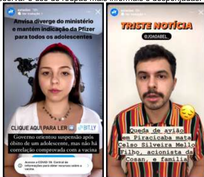
Figuras 3 e 4: Principais jornalistas que mais aparecem nos stories do Estadão, onde é possível observar o uso de roupas mais informais e despojadas.

O relato do criador do Drops de que a porcentagem do público jovem aumentou esclarece o porquê da linguagem escolhida para comunicar no story do Instagram do Estadão. A utilização de GIF's , emojis , vídeos divertidos, ferramentas de interação e as falas dos apresentadores são destinadas a esse público específico, apropriando-se de gírias e termos comumente usados pela faixa etária. Neste caso, ao público mais jovem. Trazendo um exemplo de uma das falas do veículo, a jornalista