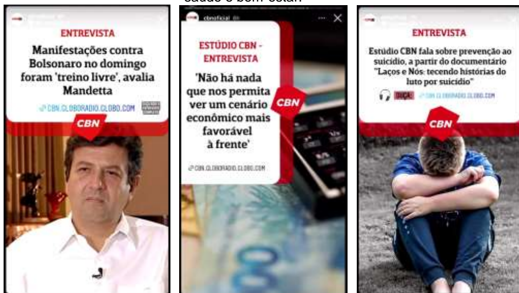
Figuras 11, 12 e 13: Stories da CBN onde destacam-se assuntos sobre política, economia e saúde e bem-estar.

Já o Estadão, especificamente no Instagram , também aborda as mesmas editorias da CBN e mais algumas, mas dá ênfase à cultura, tecnologia e política. Por ser voltado a um público jovem, os stories são criados pensando nisso (figuras 14, 15 e 16). “Aquele assunto”, por exemplo, é um projeto criado para essa faixa etária de seguidores e ganha espaço dentro do Drops todos os dias da semana. Trata-se de um projeto da 31ª turma do Curso Estado de Jornalismo do Estadão sobre “educação